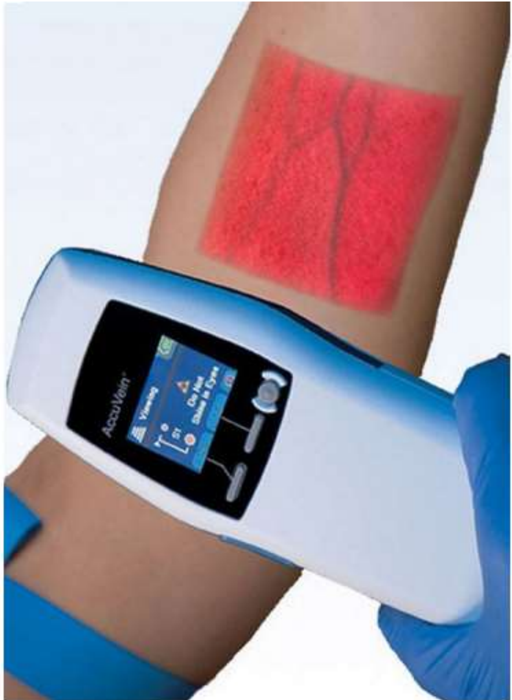
FIGURA 1 VISUALIZADOR DE VENA CON DISPOSITIVO DE LUZ LASER INFRARROJA (AccuVein)