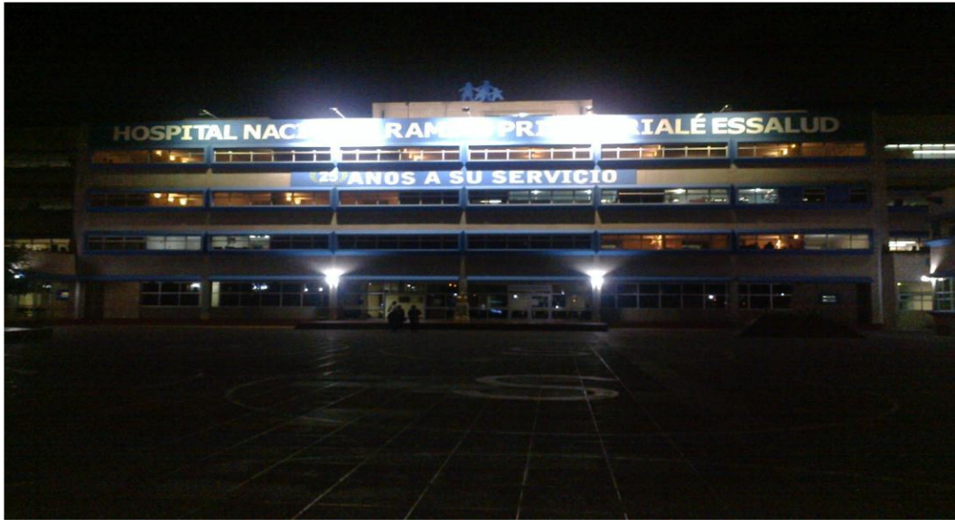
Frontis del Hospital Nacional Ramiro Prialé Prialé, Huancayo – Junín – Perú 2015