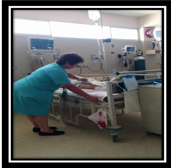
Foto 1: Intervención de enfermería en sala de recuperación pos anestésica