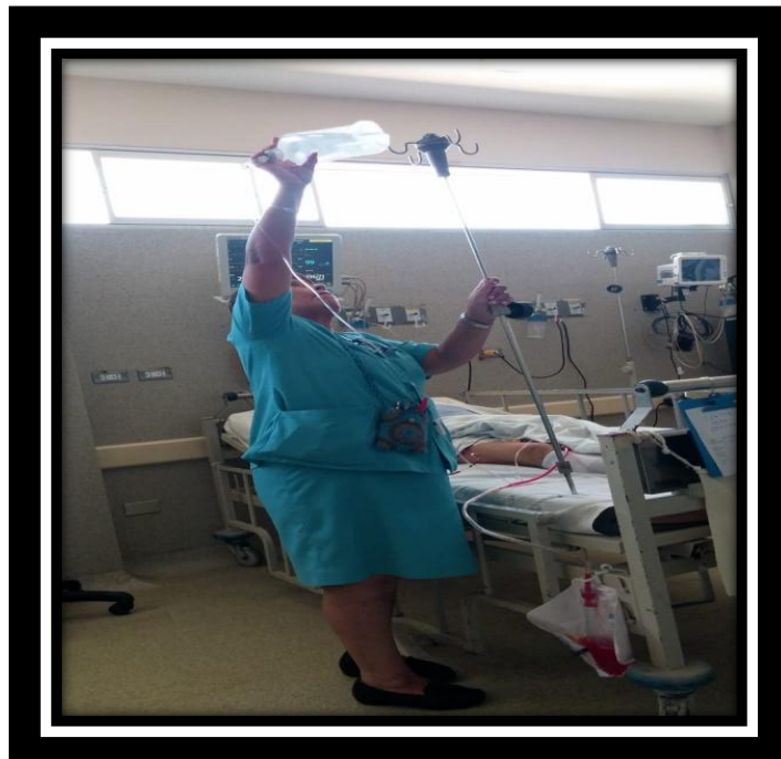
Foto 2: Intervención de enfermería permeabilizando la sonda de irrigación vesical