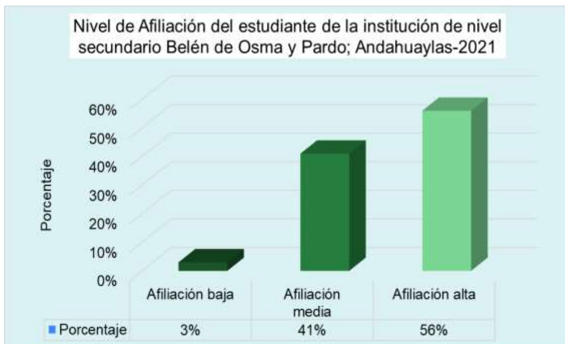
Tabla 5.9. Distribución de los participantes según dimensión afiliación de estudiantes del 5to año de secundaria del colegio Belén de Osma y pardo; andahuaylas -2021.