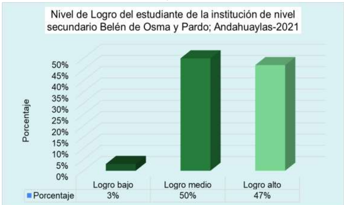
Grafico 5.7. Distribución de los participantes según dimensión logro de estudiantes del 5to año de secundaria del colegio Belén de Osma y pardo; andahuaylas -2021.

Interpretación: El nivel más frecuente en relación a la dimensión Logro, el más frecuente es el logro medio con un 50%, seguido de logro alto con un 47% y por último logro bajo con un 3%.