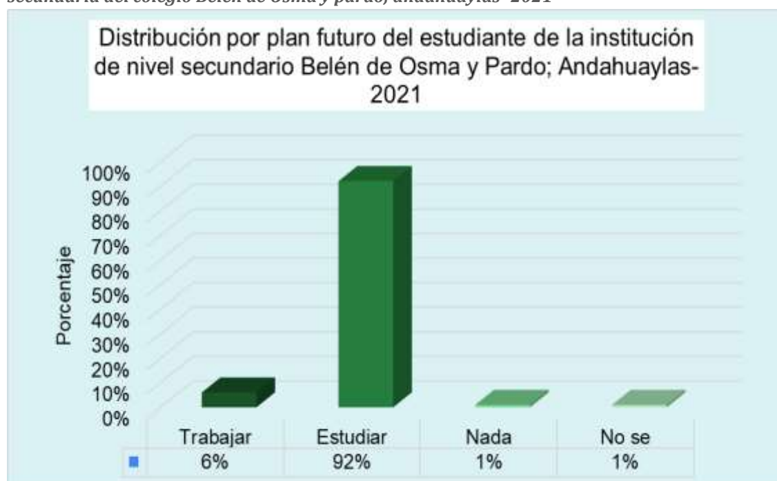
Grafico 5.4. Distribución de los participantes según plan futuro de estudiantes del 5to año de secundaria del colegio Belén de Osma y pardo; andahuaylas -2021

Interpretación: El grupo con mayor frecuencia es el de estudiar con un 92%, seguido de Trabajar con un 6%, luego el grupo que No sabe con un 1% y el grupo que tiene planificado hacer Nada con un 1%.