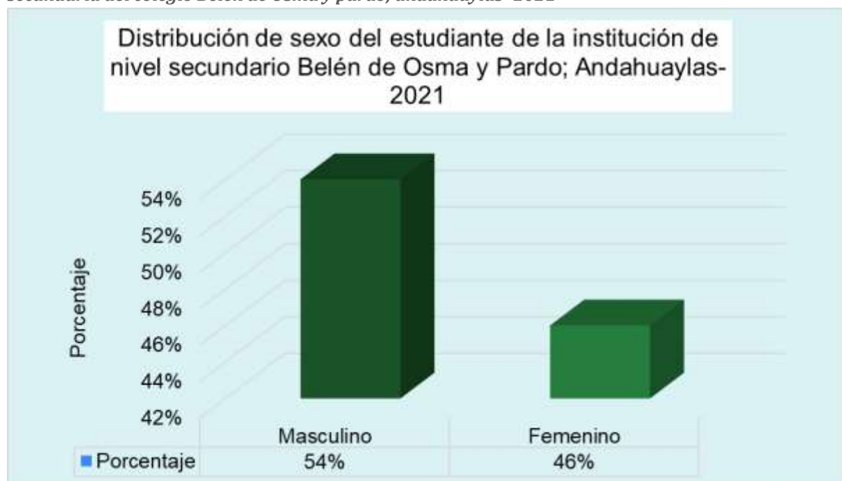
Grafico 5.1. Distribución de los participantes según sexo de estudiantes del 5to año de secundaria del colegio Belén de Osma y pardo; andahuaylas -2021

Interpretación: El grupo con mayor frecuencia es el Masculino con un 54% seguido de femenino con un 46%.