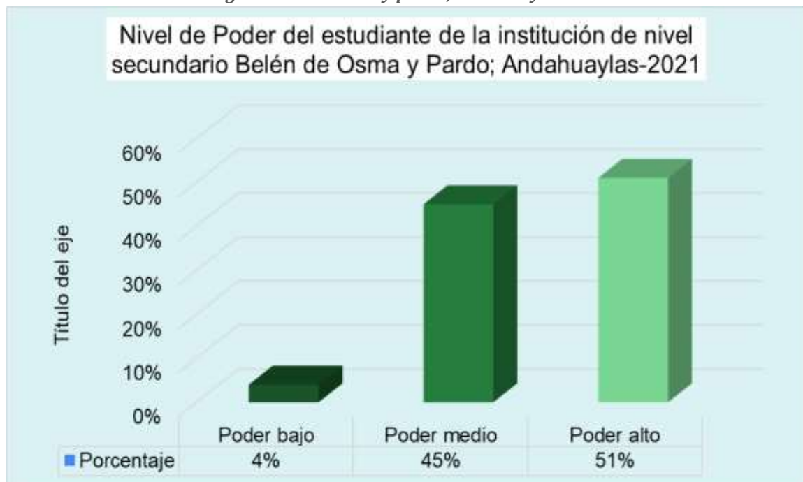
Gráficos 5.8. Distribución de los participantes según dimensión poder de estudiantes del 5to año de secundaria del colegio Belén de Osma y pardo; andahuaylas -2021.

Interpretación: El nivel más frecuente en relación a la dimensión poder el más frecuente es el poder alto con un 51%, seguido de poder medio con un 45%, y por último poder bajo con un 4%.