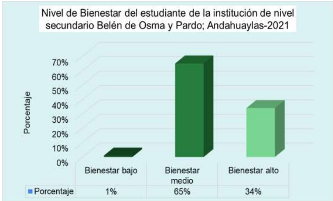
Grafico 5.6. Distribución de los participantes según variable bienestar psicológico de estudiantes del 5to año de secundaria del colegio Belén de Osma y pardo; andahuaylas -2021.

Interpretación: El nivel más frecuente en relación a la variable bienestar psicológico es el nivel medio con un 65%, seguido de alto con un 34% y por último con nivel bajo con un 1%.