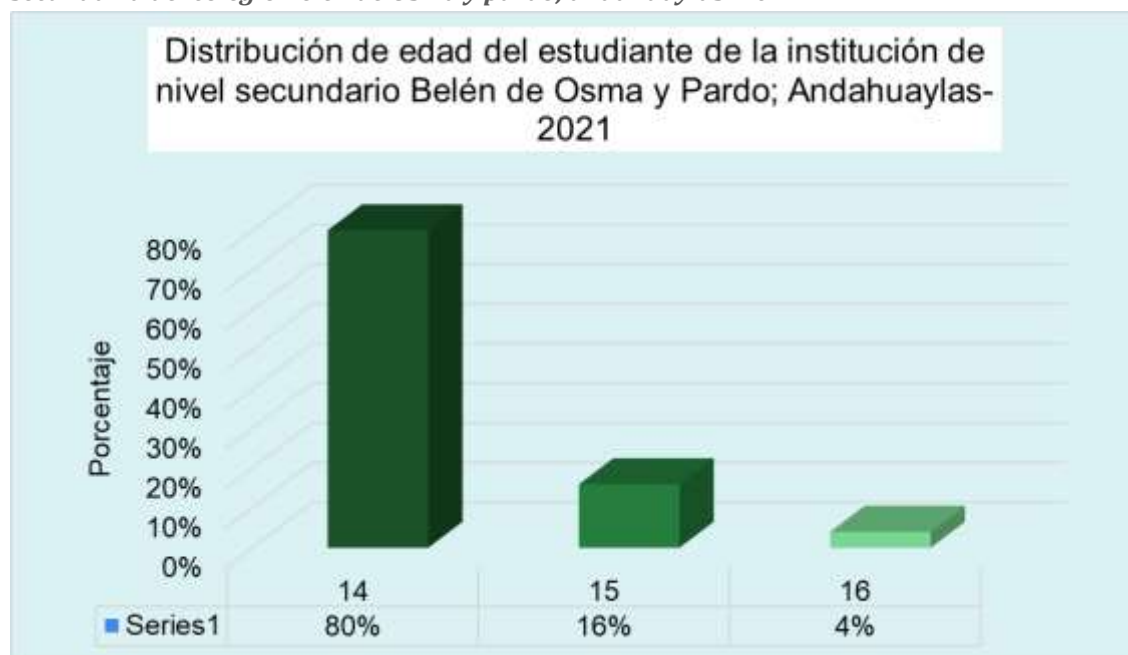
Grafico5.2. Distribución de los participantes según edad de estudiantes del 5to año de secundaria del colegio Belén de Osma y pardo; andahuaylas -2021

Interpretación: la edad más frecuente es la de 14 años con 80%, seguido de 15 años con un 16%, por último, de 16 años con un 4%.