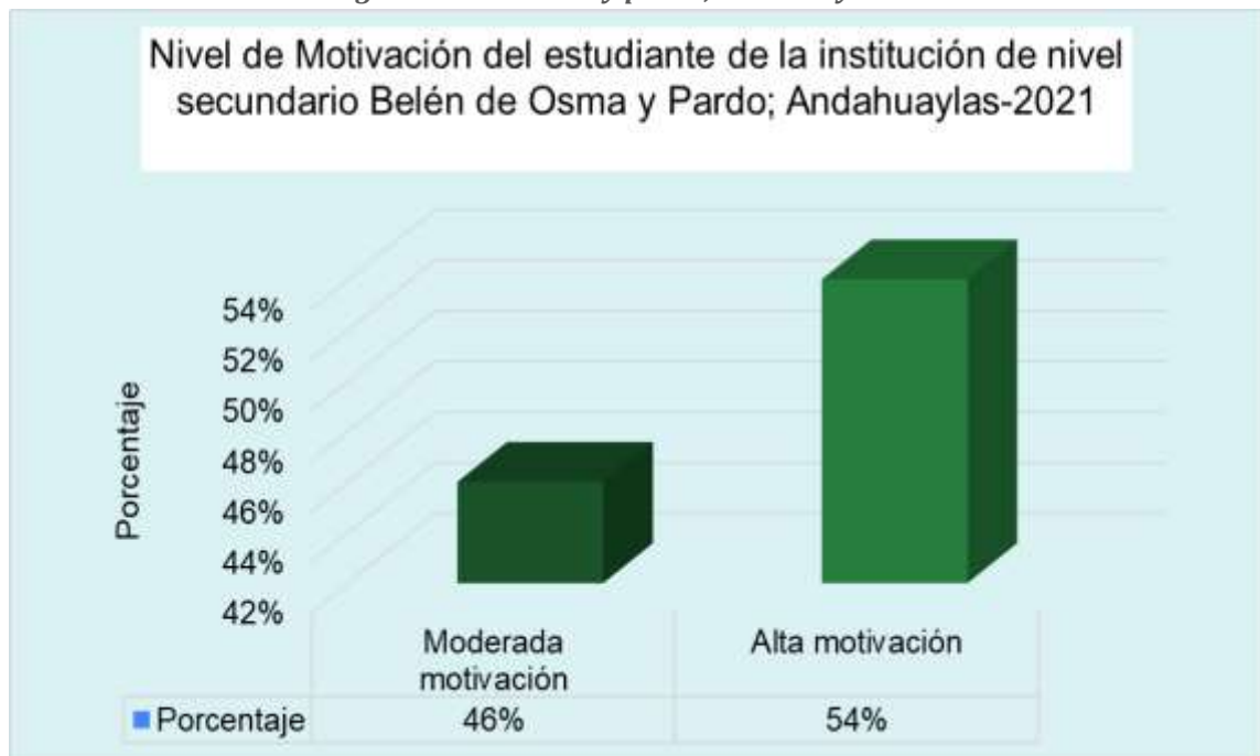
Grafico 5.5. Distribución de los participantes según variable motivación de estudiantes del 5to año de secundaria del colegio Belén de Osma y pardo; andahuaylas -2021

Interpretación: El nivel más frecuente en relación a la variable motivación es el de alta motivación con un 54%, seguido de moderada motivación con un 46%.