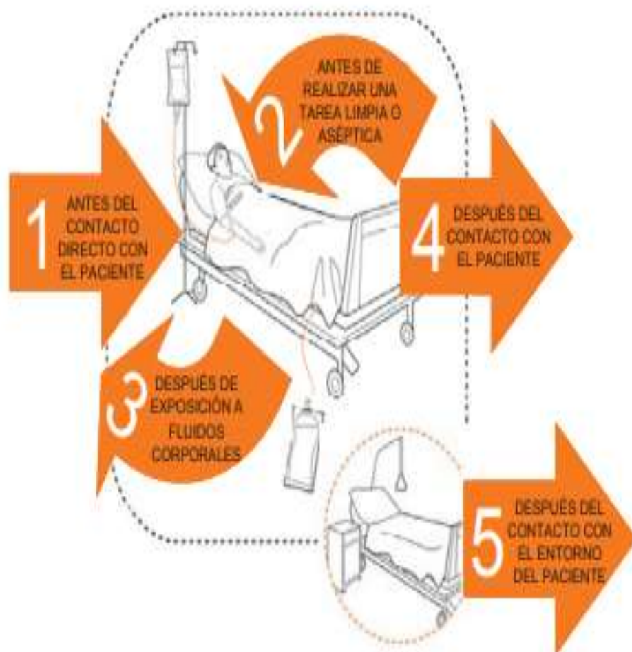
Figura 4: Los Cinco momentos de la higiene de manos

Fuente: Hand hygiene Technical Referente Manual Organización Mundial de la Salud. 2009 (26) Pág 9