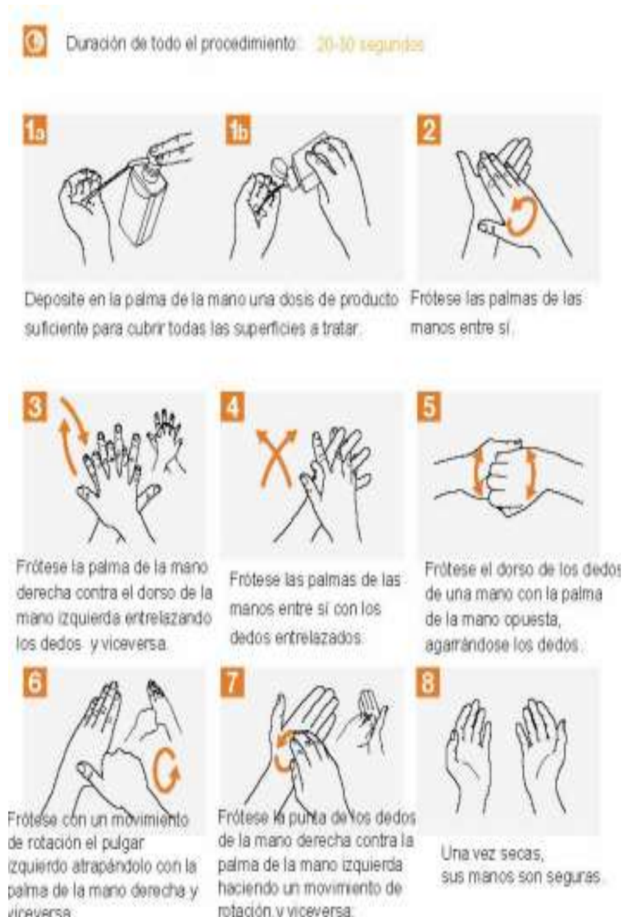
Figura 5: Técnica de Frotación de manos con solución alcohólica