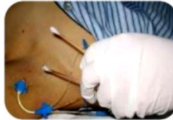
Limpieza con alcohol 2 tiempos