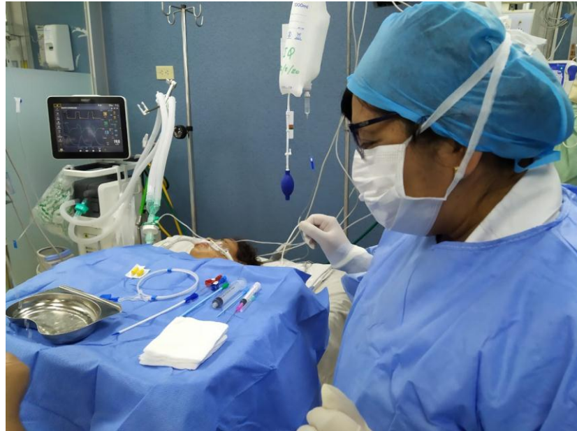
Figura 1.- Presentación de la mesa de mayo con material y personal de enfermería listos para el procedimiento de colocación del catéter venoso central en cirugía del Hospital Cayetano Heredia.