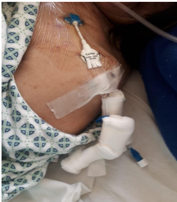
Figura 4.- Lo que no se debe hacer: CVC sin etiqueta de fecha ni protección de lúmenes. Alto riesgo de infección.