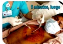
Dejar impregnación de 2 a 3 min