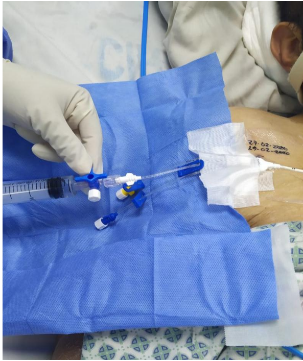
Figura 3.- Etiquetado del CVC con fecha de colocación y fecha de curación.