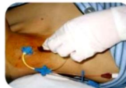
Limpieza con iodo en 3 tiempos