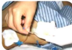
Limpieza por lúmenes