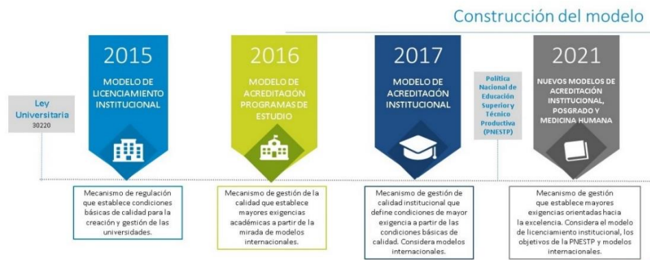
Figura 1 construcción de los Modelos de Acreditación.

Una tarea pendiente en la mayoría de las universidades es la acreditación de los programas. El Ministerio de Educación a través del Sineace, ha construido un modelo de acreditación el 2016 y un modelo de acreditación institucional el 2017, como se presenta en la siguiente figura.