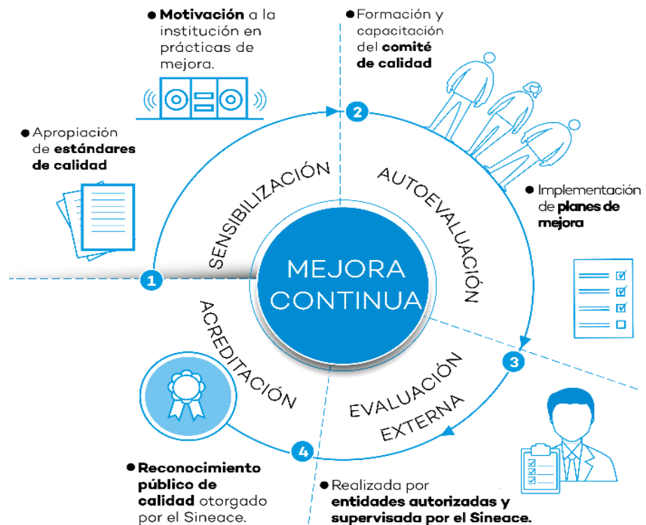
Figura 2. Proceso de la Acreditación

Para iniciar el proceso de acreditación se requiere sobre todo una decisión política por parte de las autoridades y luego el trabajo efectivo de los comités de calidad en las facultades. El nivel de conciencia de nivel superior que tengan los actores fue muy importante para hacer realidad este proceso que se presenta en la siguiente figura.